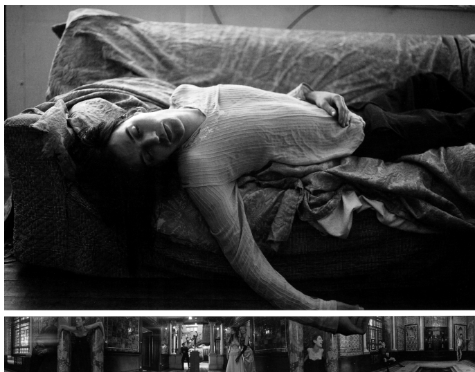
Fig. 9. Taylor-Wood, Soliloquy I , 1998.

di rappresentazione ravvicinata: il bordo anteriore verticale della lastra di marmo coincide in tutta la sua estensione con il margine inferiore del quadro e i piedi del Cristo sembrano sfondare il limite ideale del dipinto. Lo spazio simulato produce il minor grado possibile di profondità; lo sguardo è bloccato dalla tenda posta dietro al tavolo di marmo. L'occhio dell'osservatore non ha vie di fuga e la struttura esortativa dell' Imago Pietatis – che si rivolge all'osservatore per condurlo a guardare e soffrire – viene mantenuta. Thürlemann rileva in questa configurazione scelta da Mantegna una forte esortazione alla comunicazione, soprattutto mediante la messa in scena delle piaghe, ma nello stesso tempo il Cristo sembra ritrarsi: il /dover comunicare/ dell'osservatore è contrastato dal /non poter comunicare/ dovuto al posizionamento in profondità del volto di Cristo. La frontalità di Cristo in Mantegna non viene negata solo all'osservatore, ma anche agli astanti, alle figure pian-