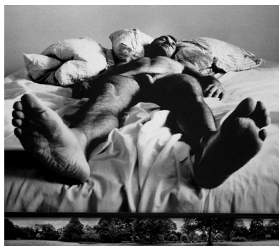
Fig. 7. Taylor-Wood, Soliloquy VII , 2000.

Per mettere in relazione le due opere, quella pittorica e quella fotografica, dovremo nel contempo prendere in considerazione sia la serie alla quale appartiene Soliloquy VII (immagine che all'interno della serie dal titolo Soliloquy viene posizionata dopo 6 immagini che portano lo stesso titolo e prima di altre due), sia la tradizione dell' I-mago Pietatis in relazione al dipinto di Mantegna. In più