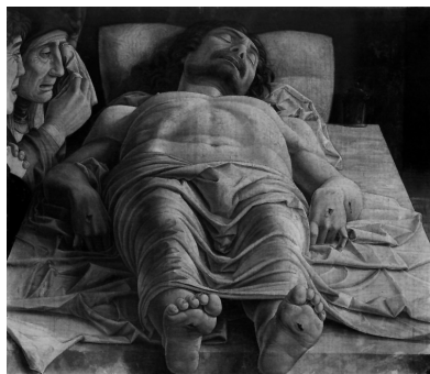
Fig. 8. Mantegna, Compianto su Cristo morto , 1500 ca.