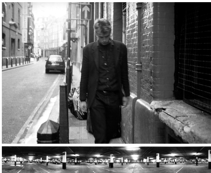
Fig. 11. Taylor-Wood, Soliloquy V , 1998.

quasi tutti i palinsesti una molteplicità di attori. La fotografia sottostante funziona in tutti i Soliloquy come visualizzazione tra sé e sé del “pensiero visivo” del soggetto dell’immagine superiore. Quest’ultima, attraverso indici proiettivi (il movimento verso il basso dell’arto del ragazzo in Soliloquy I , lo sguardo in diagonale dell’uomo in Soliloquy II , lo sguardo direzionato in basso del giovane di Soliloquy V , fig. 11, la testa della ragazza ripiegata su se stessa in Soliloquy VI ecc.) finisce per essere letta come istanziatrice dell’immagine seconda, cioè del pannello inferiore. Possiamo quindi inquadrare il rapporto tra le due immagini come relazione di débrayage dell’una verso l’altra, vale a dire che siamo di fronte a un débrayage di secondo grado, cioè al débrayage di un racconto interno che è proprio a ciascun soliloquio. Inoltre possiamo osservare che il racconto interno rende più intenso il primo racconto, lo rende cioè più presente .