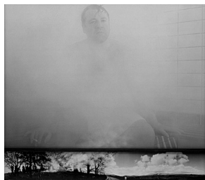
Fig. 12. Taylor-Wood, Soliloquy IX , 2001.

tivi) esemplifica l'atto del soliloquie nella sua fase di ri-appropriazione, da parte dell'enunciatore, delle proiezioni narrative che fa di se stesso. Il soliloquio è un proiettarsi alla presenza di molti, diversi se stessi attraverso l'esistenza dei quali, infatti, quest'atto trova la sua ragion d'essere: "il soggetto torna a sé dall'analisi delle proprie esteriorizzazioni " (Ricoeur 1990, p. 41) e se ne ritrova trasformato; è quindi nella fortissima efficacia simbolica retroattiva che il soliloquio mostra tutta la sua pregnanza e il suo potere costitutivo di identità. È nell'atto interpretativo di ri-assunzione del suo stesso discorso che il soggetto enunciatore costituisce in termini polari il proprio e l'estraneo: "di fronte all'impossibilità di un'intuizione originaria dell'io, non resta che la paziente opera di recupero dell'io a partire da ciò in cui si attua, si incarna, si realizza" (ib.).