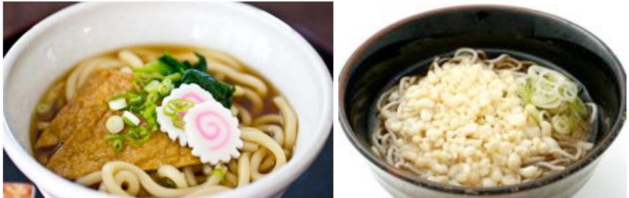
Figg. 5 e 6 - Kitsune udon e tanuki soba.

In diverse leggende si tramanda che per trasformarsi una kitsune deve posarsi sul capo o una canna, o una foglia larga o un teschio e una volta assunte le sembianze altrui tende a mantenere la coda. Le volpi possono tradire il loro vero aspetto per ubriachezza o paura dei cani, ma sono anche specializzate nella creazione di illusioni e nell'ingresso nei sogni.