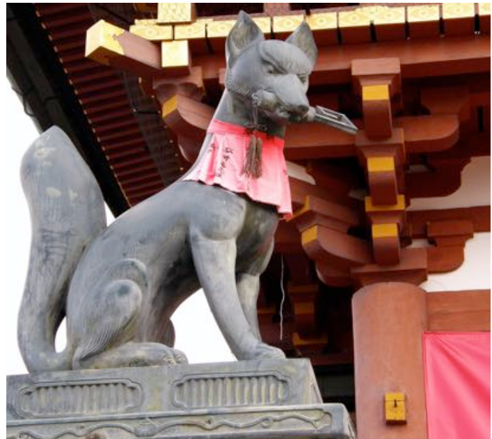
Figg. 3 e 4 - Raffigurazione di Inari con volpe bianca al seguito e statua di kitsune con yodarekake.