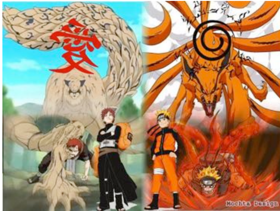
Fig. 7 - Gaara con Shukaku, Naruto con Kurama e le relative metamorfosi dei due ninja (©Mochta Design).