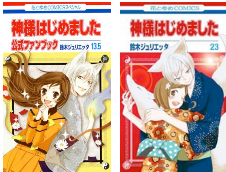
Fig. 9 - Nanami e Tomoe ritratti su due copertine del manga Kamisama Hajimemashita , su cui è visibile anche il simbolo yin yang.

Gli amatsukami , le divinità celesti, incaricarono Izanami e il fratello gemello Izanagi di popolare la terra ancora nel caos, ma la dea morì di parto e divenne la governatrice dello Yomi. I gemelli sono rappresentati nel culto shintoista da due scogli affioranti dal mare situati nella baia di Futami, presso il tempio di Ise. Le sacre rocce sono legate da una treccia di paglia di riso chiamata shimenawa , segno di unione divina, e vengono considerate come una figurativizzazione del concetto di armonia dei contrari. Nanami e Tomoe si recano proprio al tempio di Ise dove avviene la riunione annuale delle divinità giapponesi.