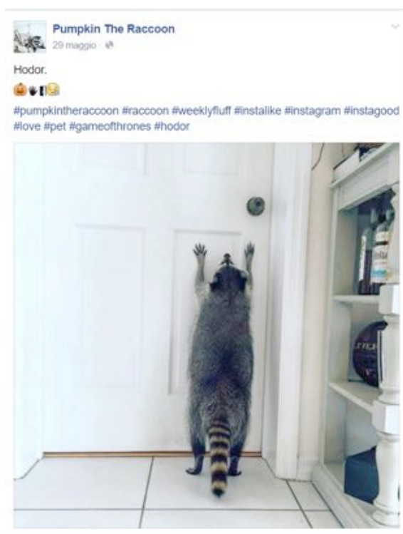
Fig. 10 - Pumpkin the Raccoon

Il frame comunicativo di Pumpkin è spesso organizzato, per dirla in termini echiani, in sceneggiature intertestuali, che prevedono un set di competenze pregresse necessarie alla corretta decodifica del post. L'esempio riportato nell'immagine seguente è esemplare: Pumpkin è ritratta con le zampe appoggiate a una porta, azione trasposta nell'ambito del testo verbale tramite una serie di emoji in forma di rebus.