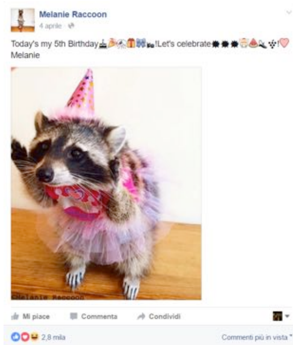
Fig. 13 - Melanie Raccoon in uno dei suoi travestimenti

In ogni foto il corpo di Melanie è trasformato, decorato, diventando un luogo di costituzione di generi identitari messi in discorso mediante i tratti riconoscibili di ogni travestimento.