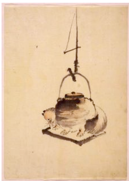
Fig. 1 - Il tanuki-teiera illustrato da Hokusai