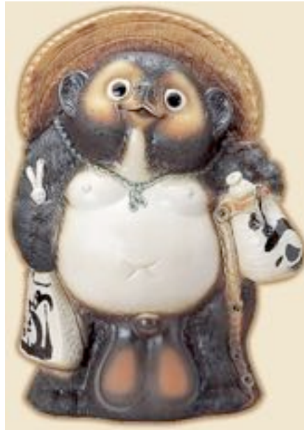
Fig. 2 - Statua raffigurante il tanuki