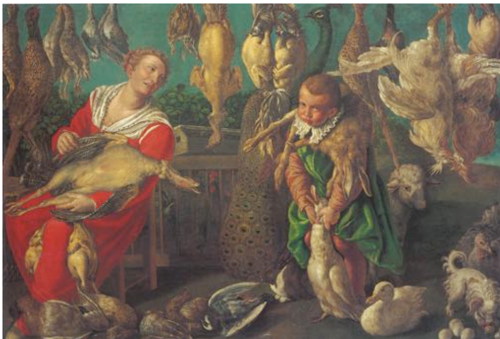
Fig. 1 – Vincenzo Campi, Pollivendoli , 1580, cm 142x215, olio su tela, Castello Fugger, Kirkheim.

Dal punto di vista cromatico, nel Mercato di polli il colore rosso al massimo grado di saturazione è riservato all'abbigliamento della figura femminile e, in minima quantità, alle creste e ai bargigli dei galli nella gabbia; il ragazzo invece ha le calze e l'abito di un rosso desaturato e quasi cangiante, mentre il suo mantello è di un verde intenso e luminoso, così come è verde il lungo collo del pavone. Tutti i volatili, e il cane, rientrano invece in una gamma cromatica che va dal bianco al marrone chiaro.