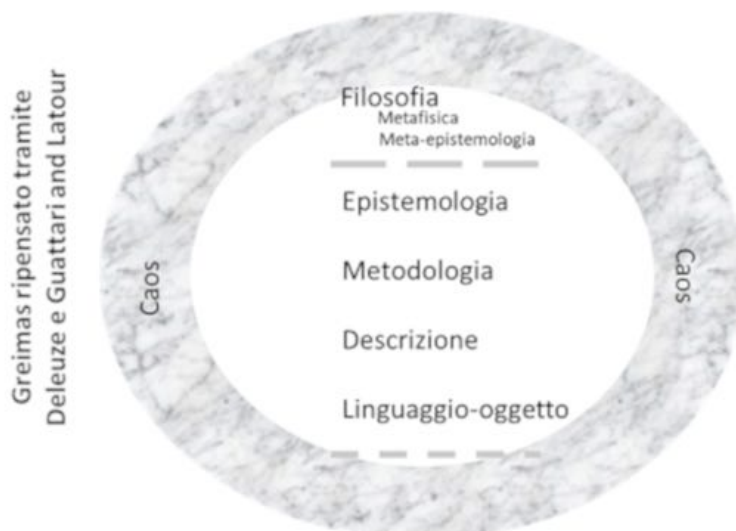
Fig. 2 – L'architettura disciplinare proposta in Greimas e Courtés (1979) ripensata a partire da Deleuze e Guattari (1991) e Latour.

La semiotica, dunque, nel momento in cui definisce lo spazio intermedio in cui opera, dovrebbe perseguire tale autonomia, che non vuol dire ignorare la filosofia – cosa che d'altra parte io non sto facendo, visto che fondo la mia argomentazione su un testo eminentemente filosofico –, ma mettere in gioco la filosofia solo quando è necessario andare oltre la riflessione epistemologica, come intesa in Greimas e Courtés. La filosofia andrebbe dunque usata solo come una sorta di meta-epistemologia – come sto facendo. Per il resto, come insegna Latour, è sufficiente seguire gli attori-attanti nelle loro peripezie. Tra questi ci sono anche i filosofi, i loro libri, i loro concetti, che non hanno uno statuto ontologico, né epistemologico, né metodologico diverso da altri attori-attanti.